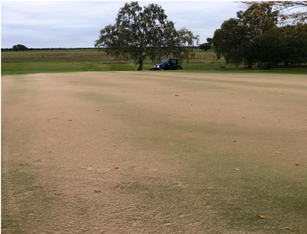
Dress ca 20ton