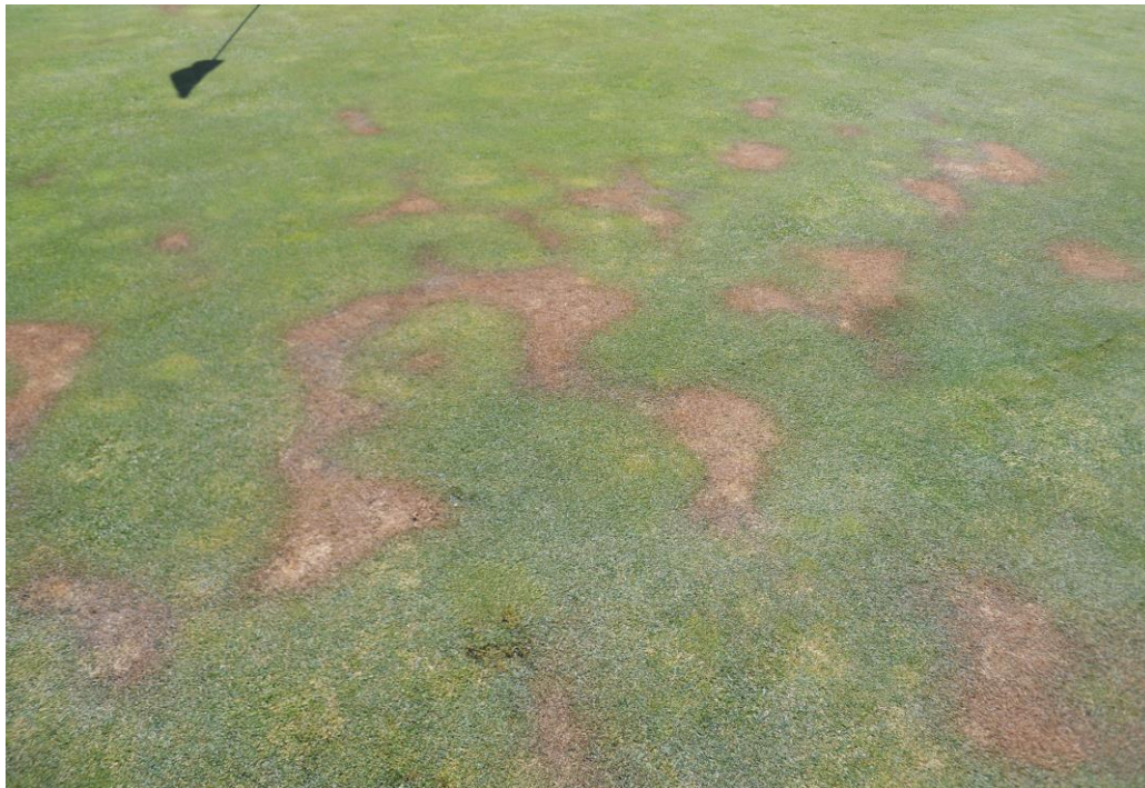
Green 18 oktober -15