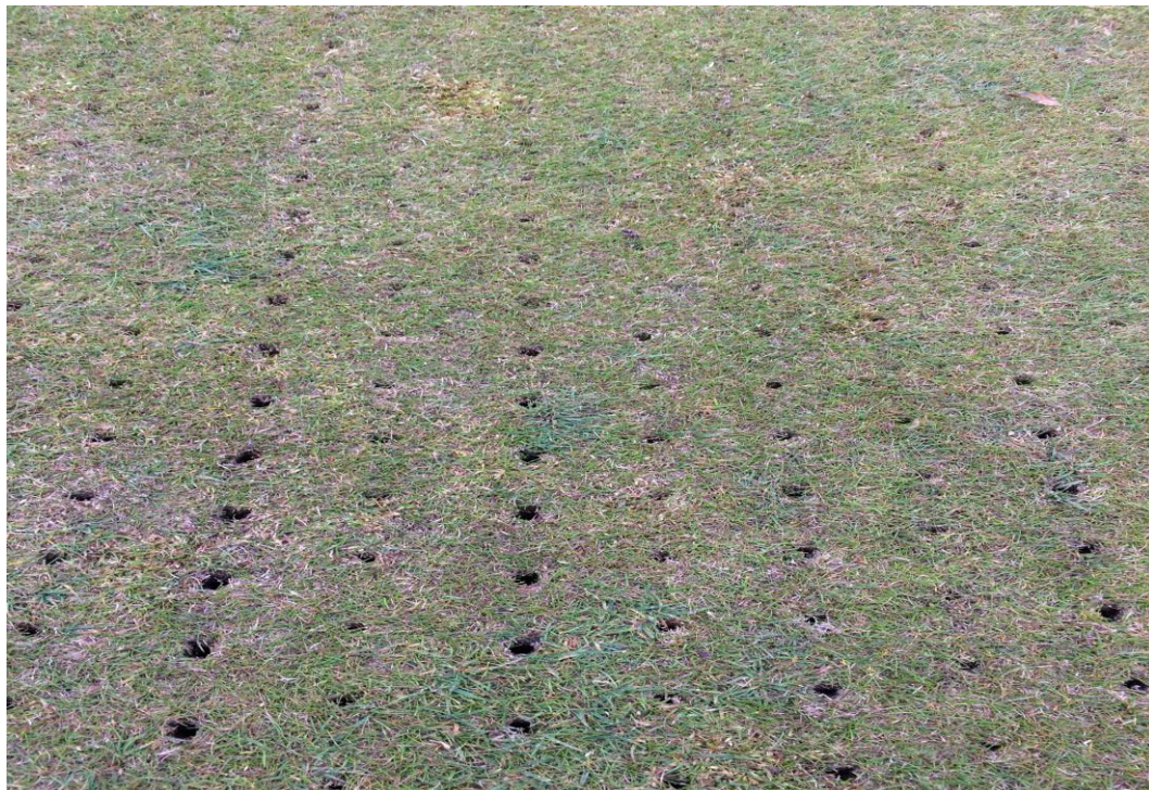
Solid 10 mm + Lawn Sand