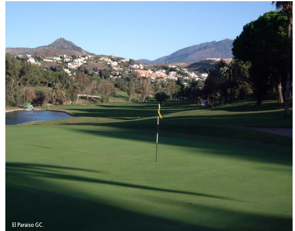
El Paraiso GC.

Tel. 08-587 086 00 | Fax. 08-587 086 10 info@golftours.se | www.golftours.se