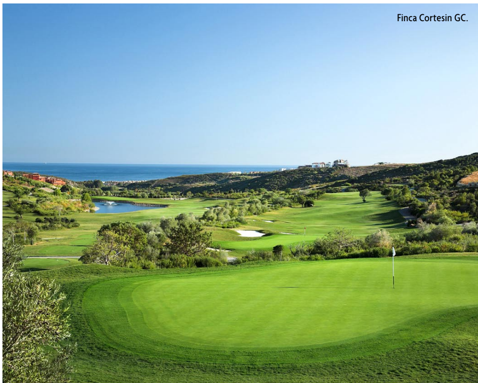
Finca Cortesin GC.

C OSTA DEL SOL ELLER SPANSKA SOLKUSTEN som vi säger i Sverige är den drygt 20 mil långa kustremsan mellan Nerja i öster till Manilva i väster.