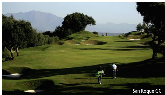
San Roque GC.

En bana som inte verkar speciellt tuff vid första anblicken. Men de flesta som tar sig an banan ändrar åsikt ganska snabbt då man ideligen får prova sina färdigheter. Vissa partier av banan är ordentligt undulerade medan andra är helt platta.