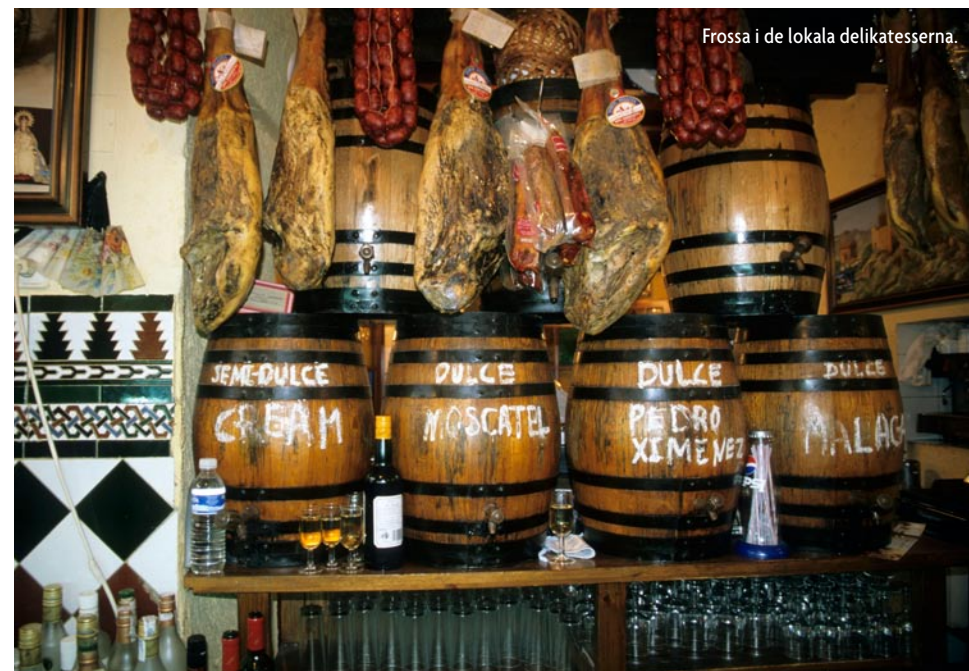
Frossa i de lokala delikatesserna.