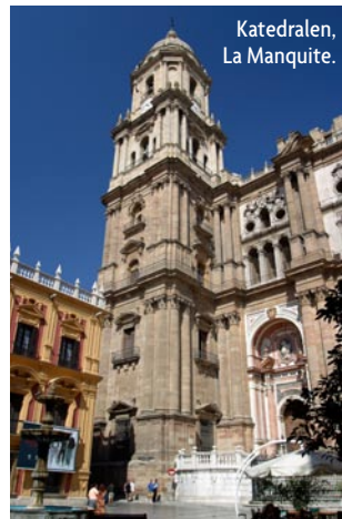
Katedralen, La Manquite.

Katedralen är starkt präglad av renässansen och barocken och är belägen i Málagas gamla stadsdel som härstammar från 1500-talet. Det anmärkningsvärda är att katedralens vänstra torn aldrig blev färdigbyggt och kallas därför i folkmun för "La Manquite" som betyder "den enarmiga".